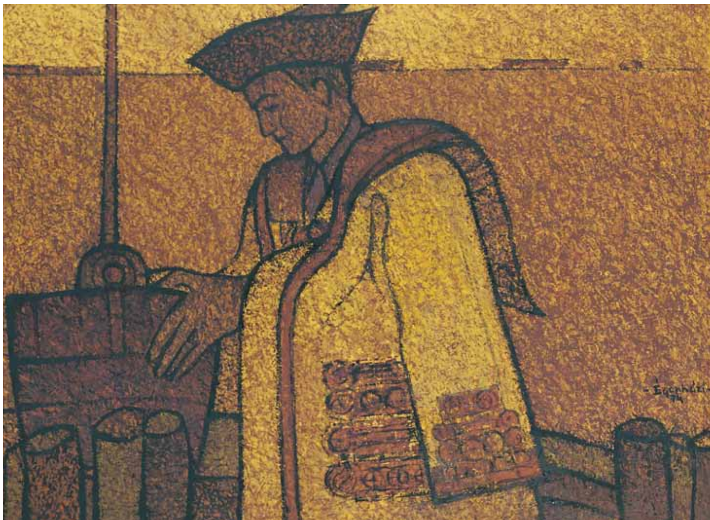
HORTOBÁGYI CSIKÓS VIZET HÚZ olaj, farost 60×80 cm, 1974

„Attól kezdve valami fokozott belső kényszer volt bennem”