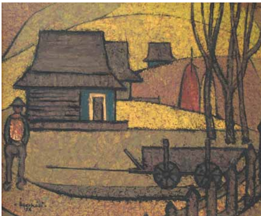
GYIMESI TÁJ olaj, fapost 50×60 cm, 1974