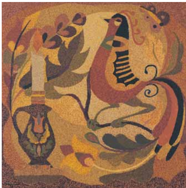
ERDÉLYI NÉPI MOTÍVUMOK olaj, farost 80×80 cm, 1979

Ő a népművészet, a legősibb néphagyomány szellemiségét is ismeri és alkalmazza. Nézzük meg például portréin a szemeket. Mondjuk a Pásztorok, a Csikós és felesége, a Krúdy világa, vagy a nagy kompozíció, a Hajdúk figuráinak szemét. Ugyanolyan szemábrázolás ez, mint az ősi indián művészeteké, ezért tűnik talán úgy, hogy ezekből a szemekből az idő mélységes kútja szívárog elő. Ugyanezt a kortalan mélységet mutatják a házak, kapuk, fák leegyszerűsített, népművészetben alkalmazott formái.