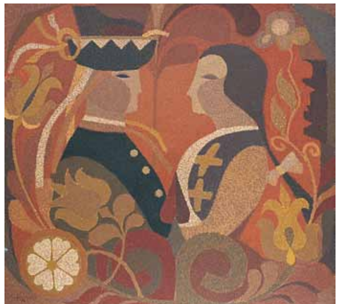
SÓS PISTA TALÁLKOZÁSA BENDE JULIVAL olaj, farost 70×75 cm, 1982