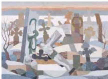
NAGYIVÁNI TEMETŐ olaj, farost 60×80 cm, 1989