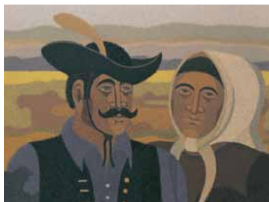
CSIKÓS SZÁMADÓ ÉS A FELESÉGE olaj, farost 60×80 cm, 1987