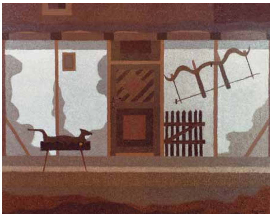
MÚLTUNK EMLÉKEI olaj, farost 80×100 cm, 1982