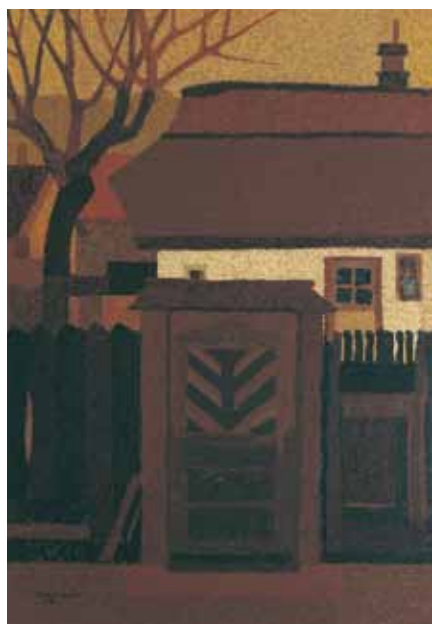
KANFAROS HÁZ olaj, farost 100×70 cm, 1982