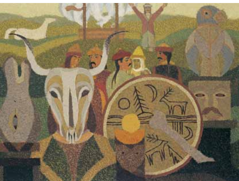
HONFOGLALÓK HITVILÁGA olaj, farost 60×80 cm, 1996