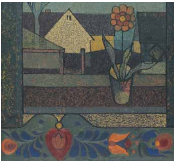
VIRÁGCSENDELÉLET LÓCÁVAL olaj, farost 63×67 cm, 1974