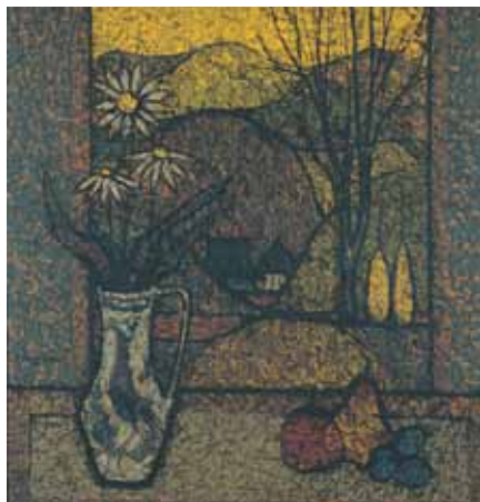
VIRÁGCSENDÉLET olaj, farost 50×50 cm, 1976