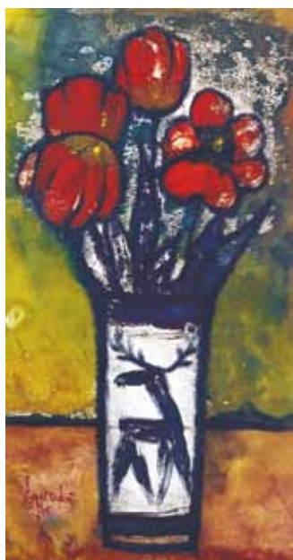
TULIPÁNYOK monotípiá, papír 61×32 cm, 1975