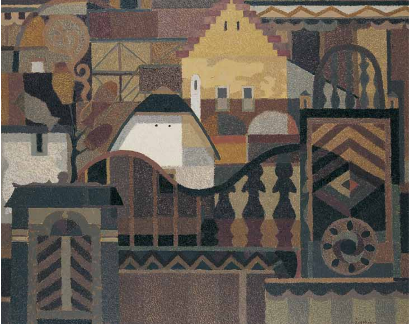
HAJDÚBÖSZÖRMÉNYI MOTÍVUMOK olaj, farost 80×100 cm, 1985