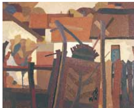
BÖSZÖRMÉNYI KISKAPUK EMLÉKÉRE olaj, farost 80×100 cm, 1984