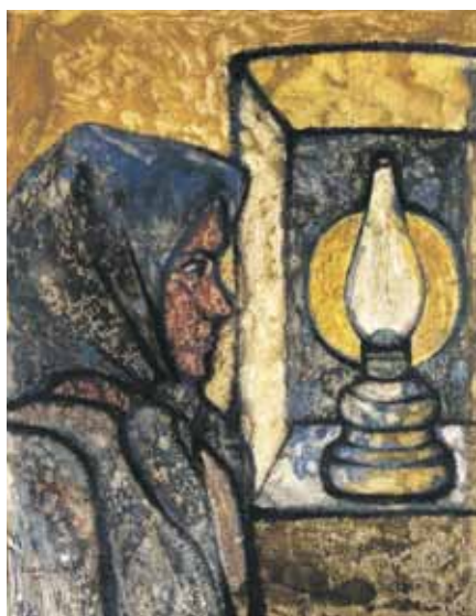
ASSZONY LÁMPÁVAL monotípiá, papír 80×62 cm, 1974